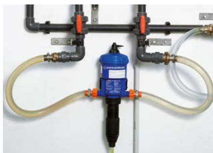
Doseur de médicaments de type 1