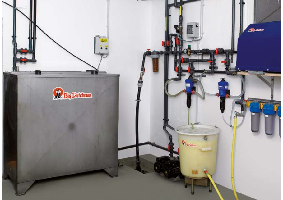
Salle de service avec petit (60 l) et grand (1000 l) mélangeur de médicaments en acier inox

Les préparations liquides sont directement pompées depuis leur emballage d'origine. Dans le cas de substances poudreuses ou visqueuses, un réservoir de mélange des médicaments équipé d'une pompe