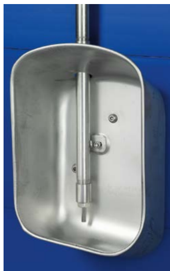
Abreuvoir bol pour l'engraissement