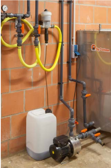
Les préparations liquides peuvent être directement pompées