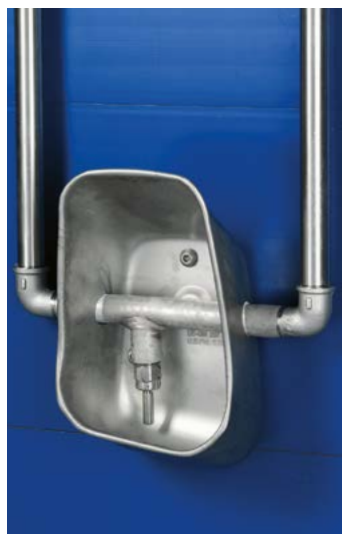
Abreuvoir bol avec dérivation pour les porcs jusqu'à 35 kg