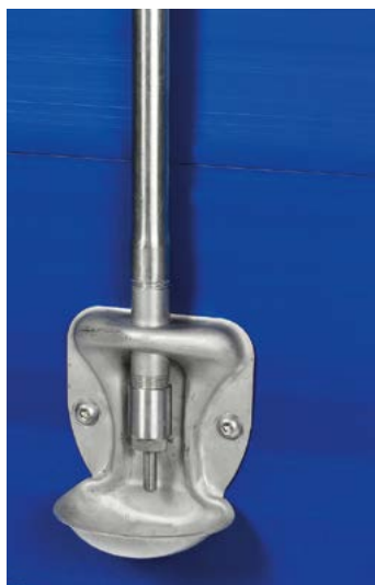
Abreuvoir bol pour porcelet sous la mère

engraissement ; ✓ abreuvoirs bol en fonte émaillée ; ils servent aussi bien aux truies qu'aux porcelets dans les cases de mise-bas.