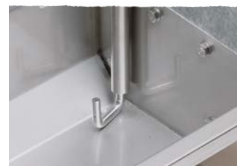
Tube à vide avec agitateur en forme de J pour auges longitudinales

Le tube à vide est utilisé pour les truies bloquées ou en salle de post-sevrage. Dès que les animaux veulent boire dans la grande auge transversale, l'eau s'écoule automatiquement. Plus l'auge est longue (max. 25 m par tube à vide), plus le système d'abreuvement est économique.