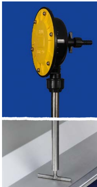
Tube à vide avec agitateur en forme de T pour auges longitudinales – haute pression

Le tube à vide est utilisé pour les truies bloquées ou en salle de post-sevrage. Dès que les animaux veulent boire dans la grande auge transversale, l'eau s'écoule automatiquement. Plus l'auge est longue (max. 25 m par tube à vide), plus le système d'abreuvement est économique.