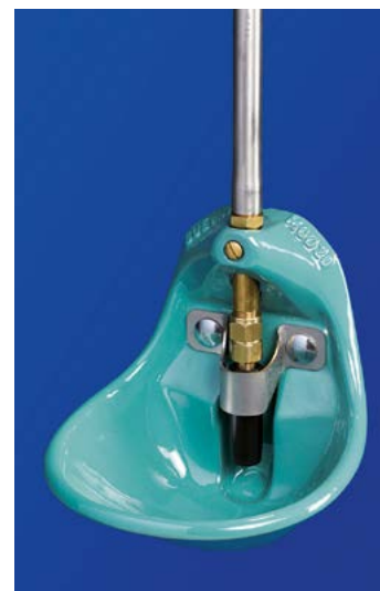
Abreuvoir bol avec protection de la vanne pour cases de mise-bas