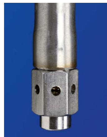
Abreuvoir arroseur pour truies – haute pression

Des conduites d'abreuvement avec étrier de protection sont également disponibles en option. Ces étriers peuvent aussi être montés ultérieurement. L'étrier de protection permet d'éviter que les animaux ne se blessent, par exemple lors de la sortie des porcs prêts à partir à l'abattoir.