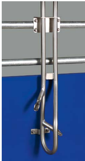
Conduite d'abreuvement avec dérivation