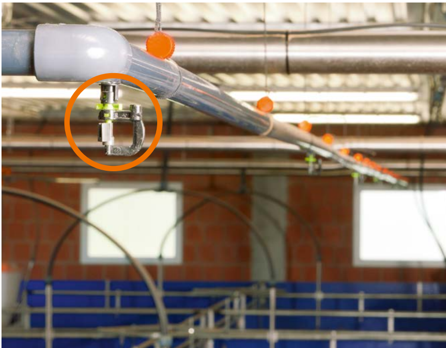
Système de trempage fixe dans un compartiment d'engraissement pour un nettoyage méticuleux du bâtiment

La commande du système de pré-trempage proposée par Big Dutchman facilite le nettoyage et raccourcit nettement le temps de nettoyage après chaque lot → moins de temps de travail ! De plus, elle réduit la quantité d'eau nécessaire au nettoyage à haute pression. Une vanne de commande électromagnétique montée dans la conduite principale d'approvisionnement permet de régler individuellement les intervalles d'arrosage ou de pause des atomiseurs de trempage en fonction du degré de salissure. La possibilité de monter les équipements en hauteur évite leur endommagement par le jet du nettoyeur à haute pression. Ce système peut facilement être adapté aux dimensions de chaque bâtiment.