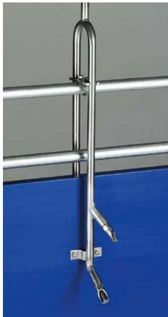
Conduite d'abreuvement pour approvisionner deux cases en eau

Toutes les pipettes et conduites d'abreuvement sont en inox et bénéficient par conséquent d'une longue durée de vie.