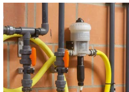
Doseur de médicaments de type 3 (résistant aux acides)